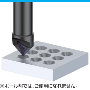
センターリング加工